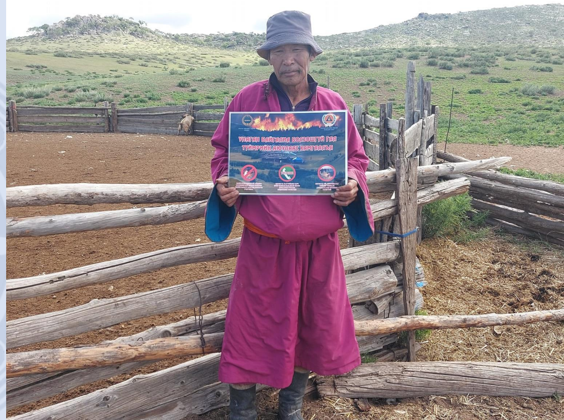
8 сумын 17 багийн 1211 иргэнд хүргэж ажиллалаа