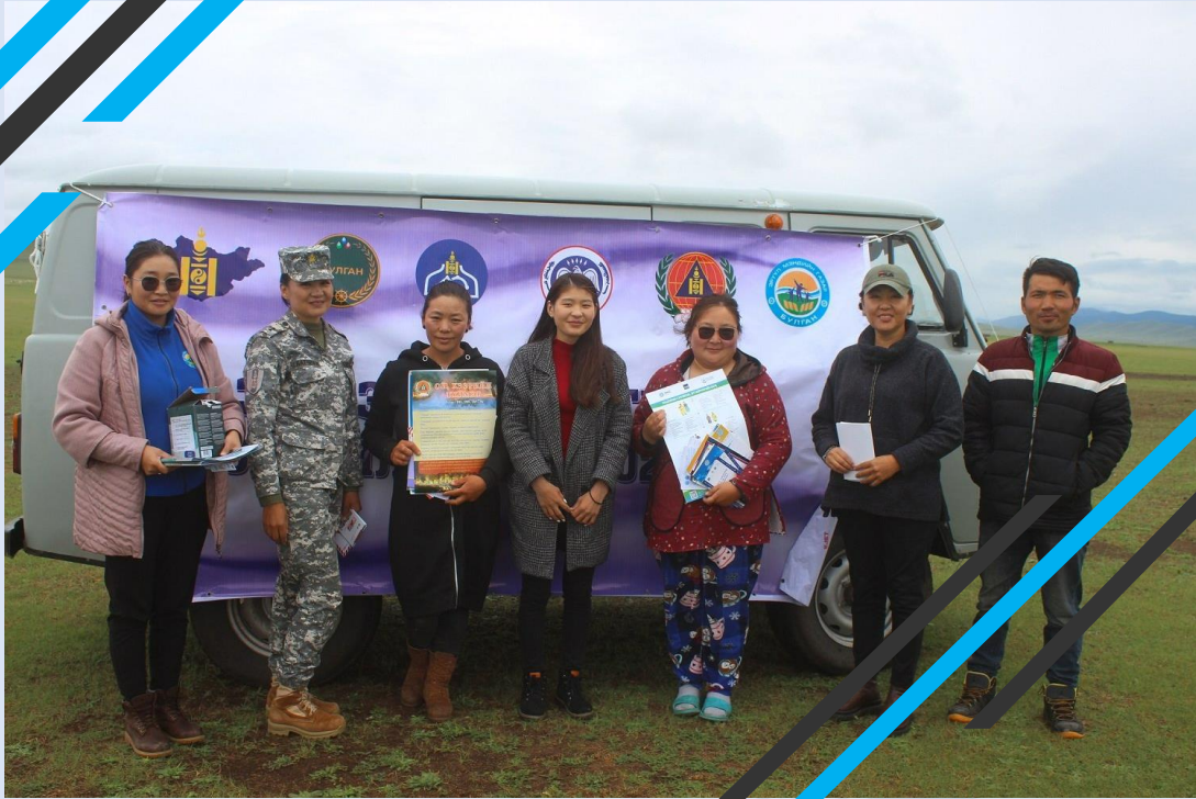
Гэр бүлийн хүчирхийллийн тоо өмнөх оны мөн үеэс 15,4 хувиар буурсан