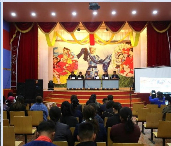
Хөгжлийн бэрхшээлтэй хүний хөгжлийн төвийн үйл ажиллагаанд дэмжлэг үзүүлж 1.4 сая төгрөг