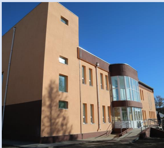
Ахмадын өргөөнд 35.6 сая төгрөгийн тоног төхөөрөмж