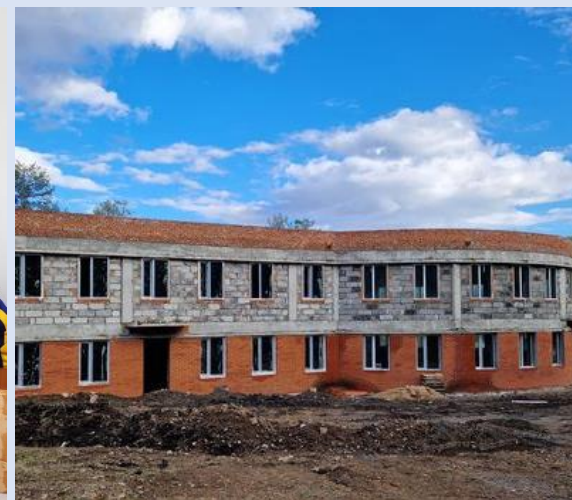
Жаргалант зуслангийн барилгын ажлыг улсын төсвийн 920.0 сая төгрөг